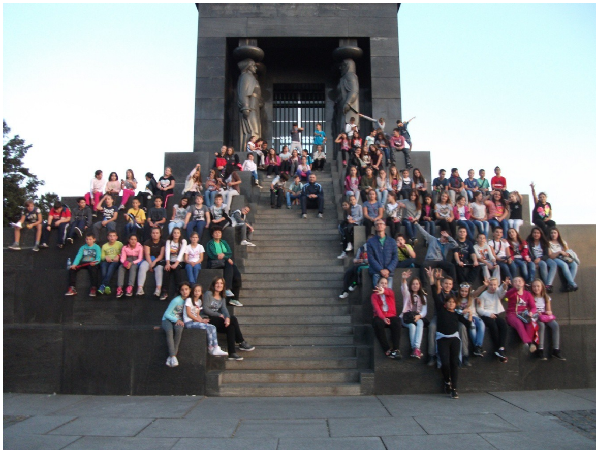
Стручно веће наставника историје и географије