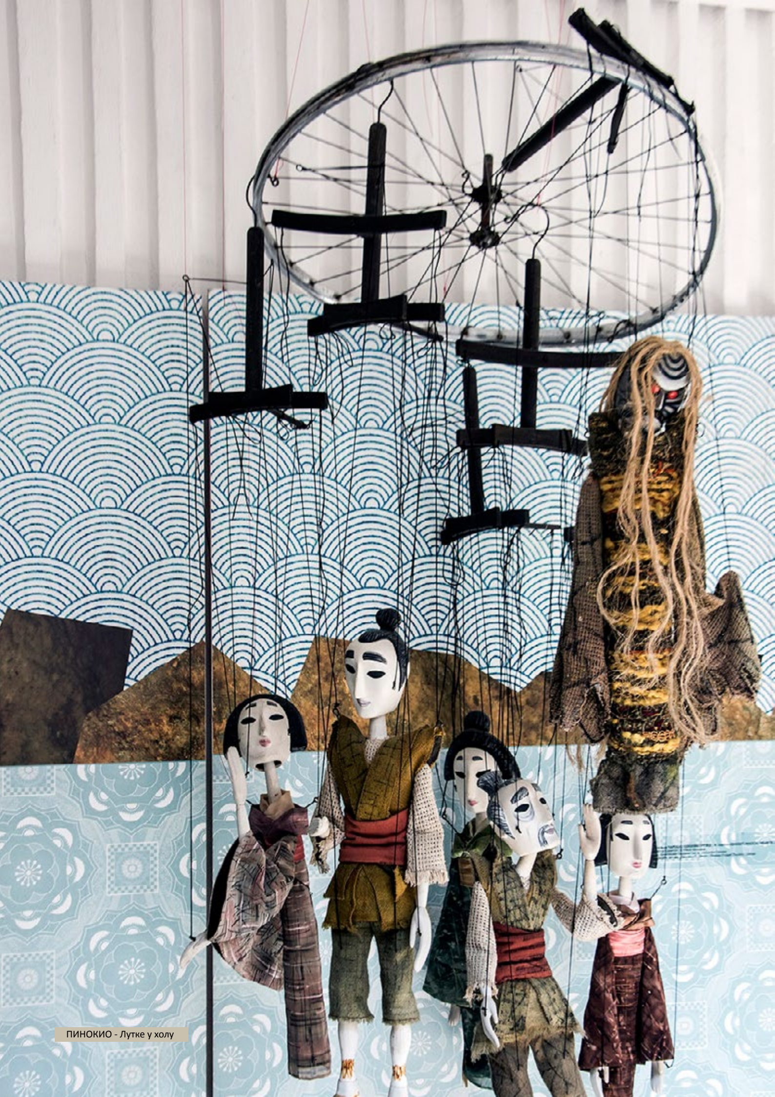
ПИНОКИО - Лутке у холу