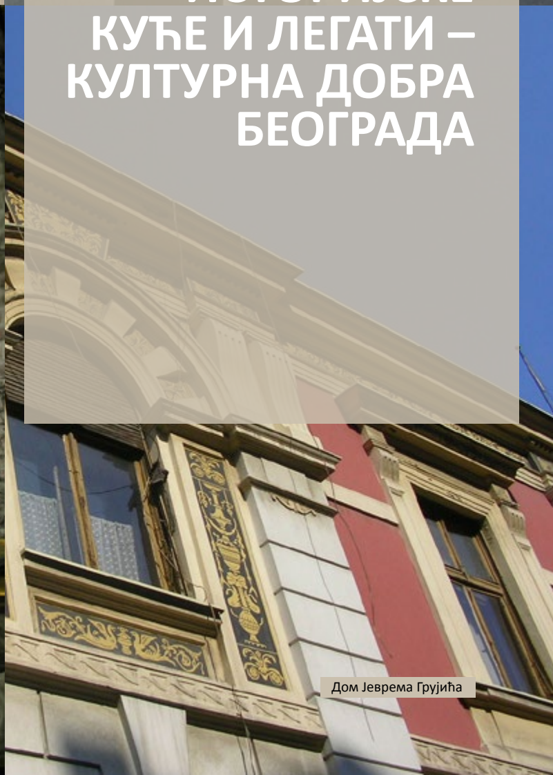
Дом Јеврема Грујића