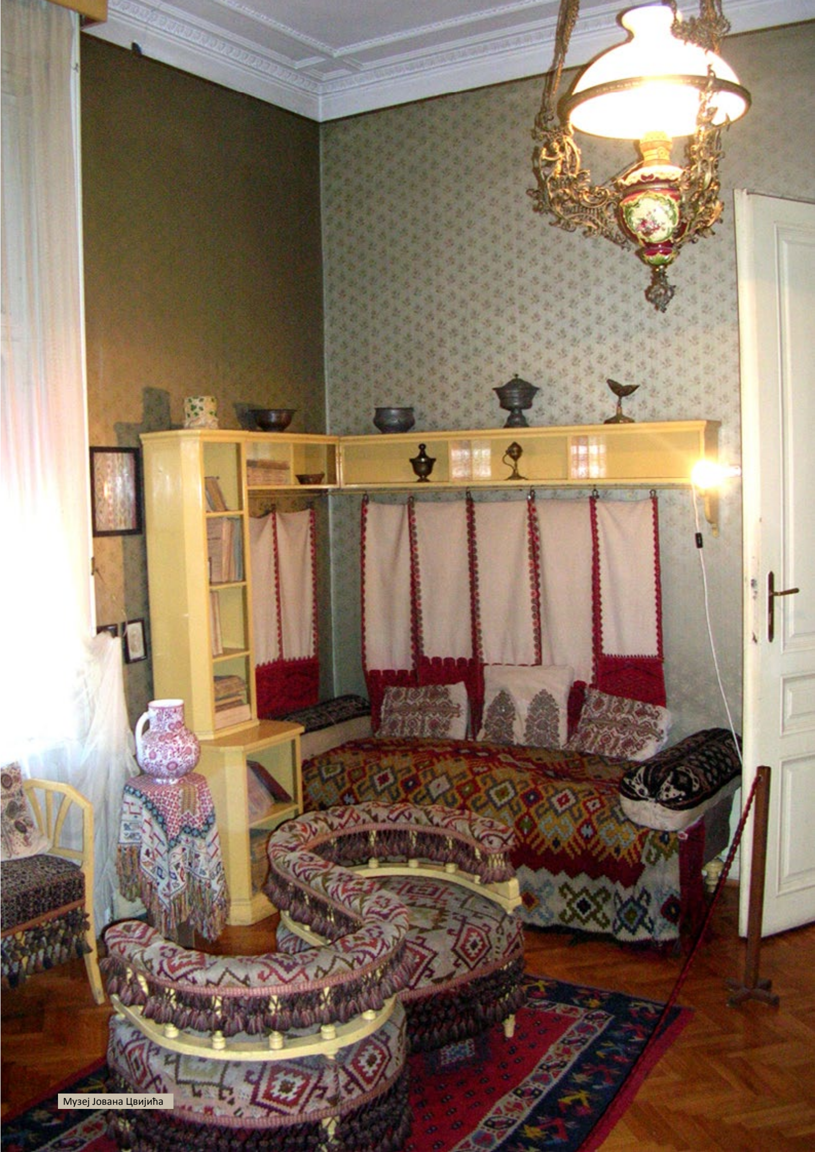
Музеј Јована Цвијића