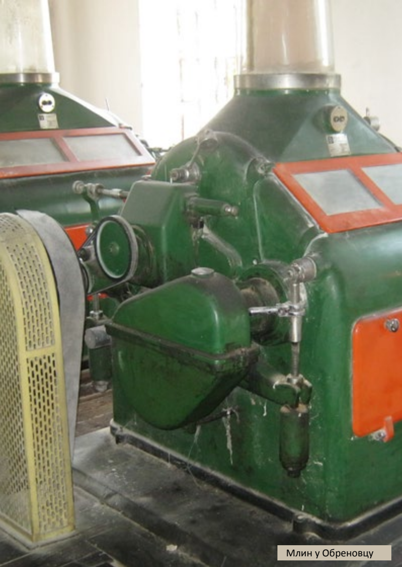
Млин у Обреновцу